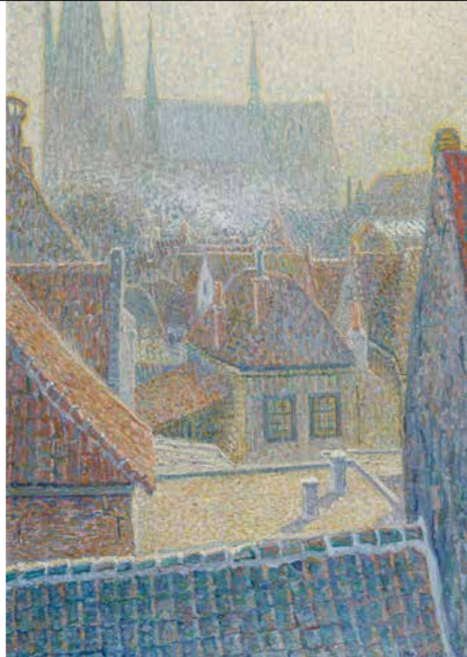
Woerden, Gezicht op de Bonaventurakerk