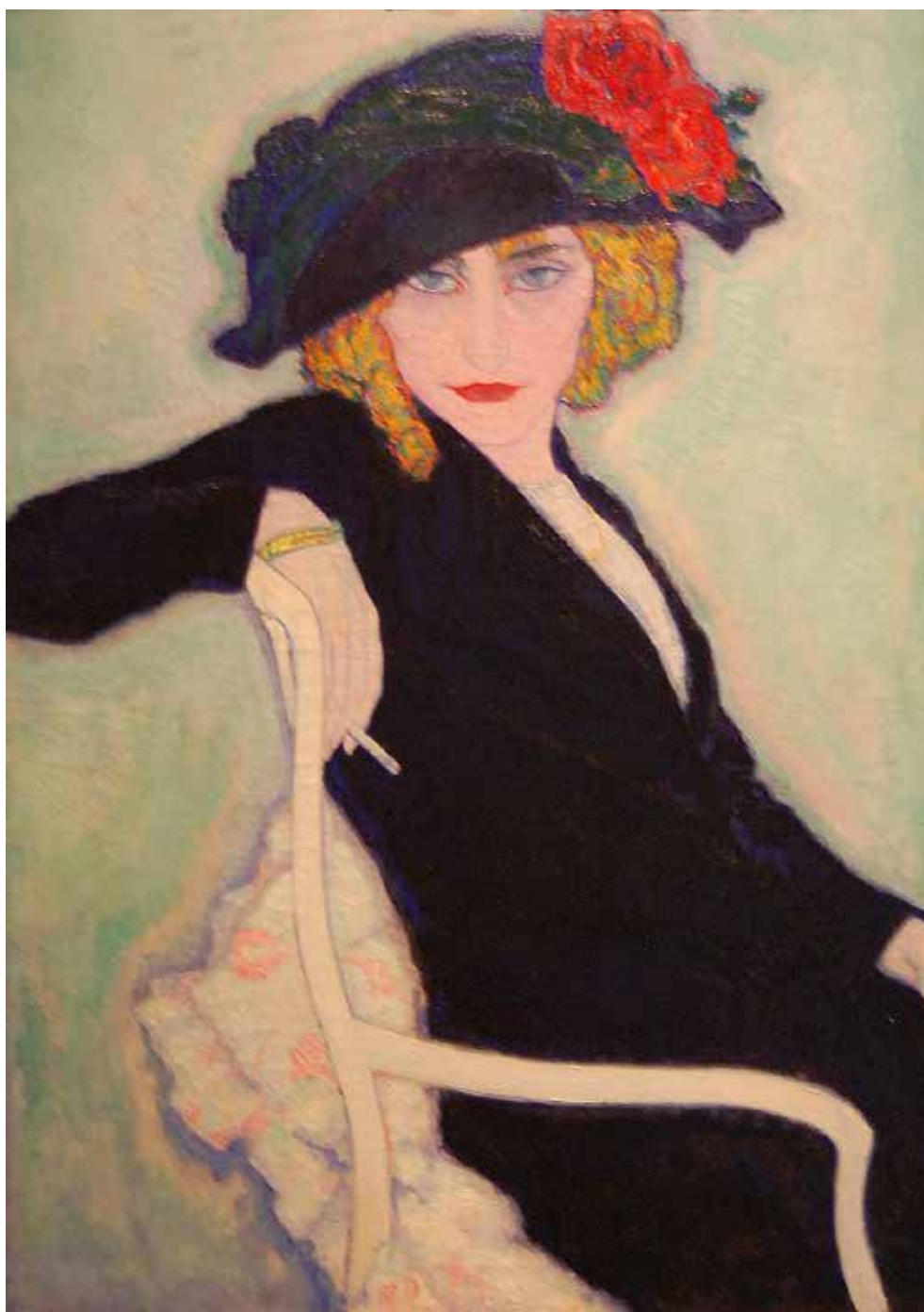
Leo Gestel | Vrouw met sigaret | 1911 | Particuliere collectie