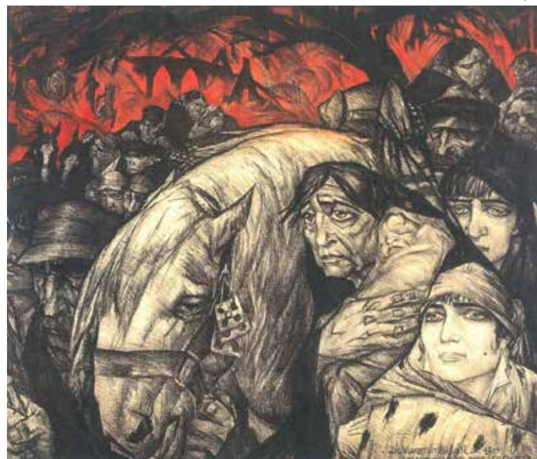
Vlucht uit België