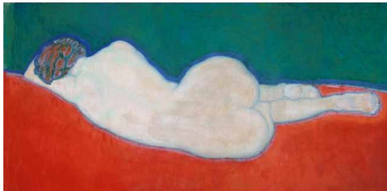
Liggend naakt op de rug gezien

Dit komt overduidelijk tot uitdrukking in zijn werk uit de Spakenburgperiode (1930-1934), hij woont dan in Blaricum.