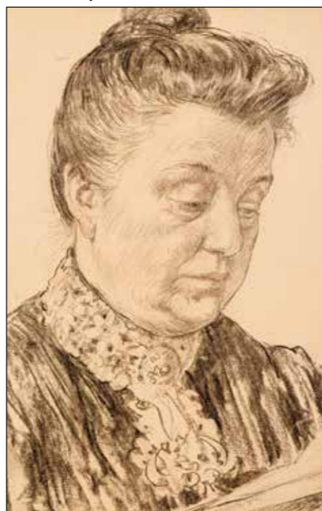
Portret van zijn moeder