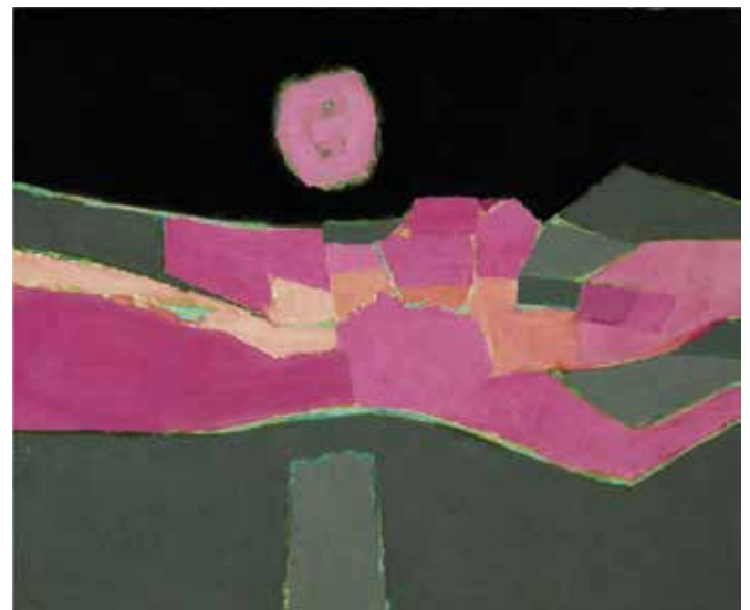
Maan boven vrouwelijk landschap