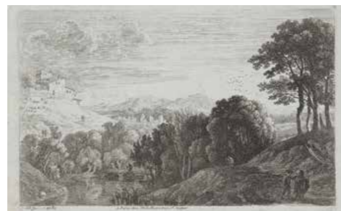
Landschap met zonsondergang Heuvellandschap met figuren

Van Swanevelt kon ook zeer realistische schilderen, hetgeen hij bewijst met zijn vele schilderijen van Romeinse ruïnes zoals dit Campo Vaccino, een groot doek in een museum in Cambridge, dat Claude Lorrain later op kleinere schaal eveneens schildert.