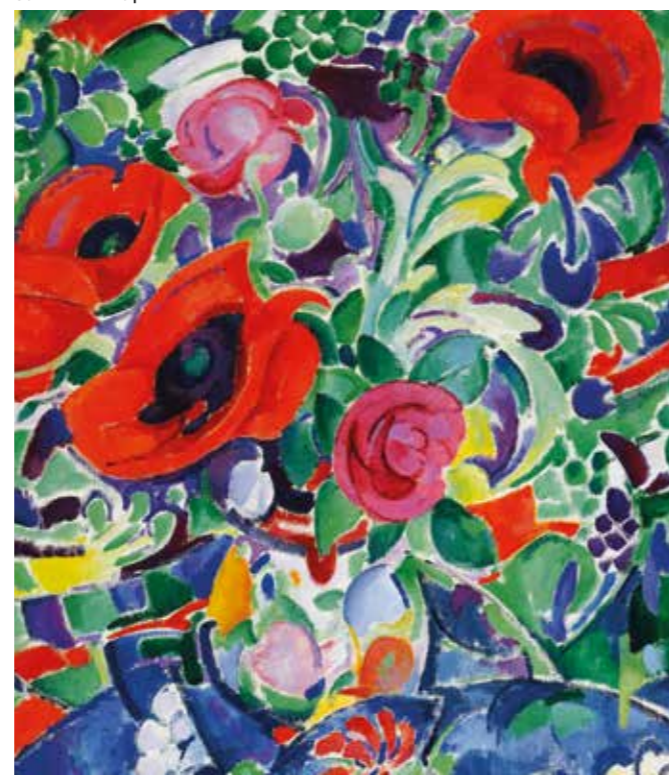
Stilleven met pioenrozen

1911 | gouache en pastel op papier | particuliere collectie Één van zijn mooiste werken: zie die prachtige trefzekere, levendige en swingende lijnen van de grote tekenaar en van een grote colorist. Zie hoe hij met een blauwe lijn de contouren van dit sierlijke lichaam aangeeft, hoe dit prachtige vrouwenlichaam zich vlijt op de rode deken; hoe Gestel met wit krijt tekening in de rug en voetzolen aanbrengt, hoe goed hij de botstructuur weergeeft: alles is hier een feest voor het oog. Werkelijk één de grote schilders en vernieuwers van de Nederlandse schilderkunst in de vorige eeuw.