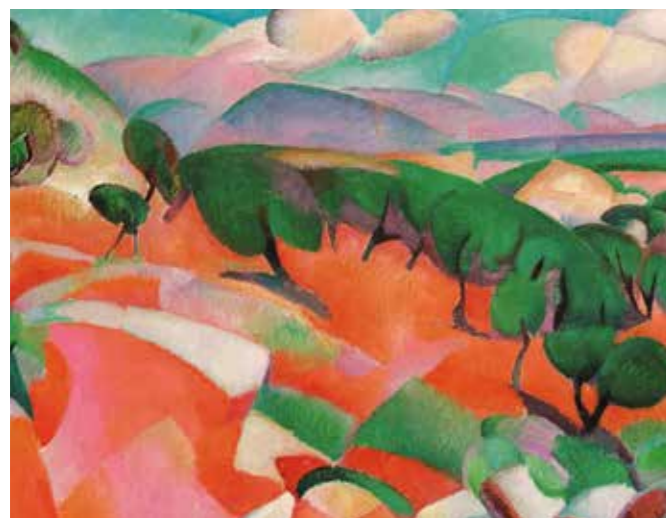
Berglandschap Mallorca | 1914

Wat een overtuigende ritmiek... weerspiegelt duidelijk een gelukkige periode in zijn leven.