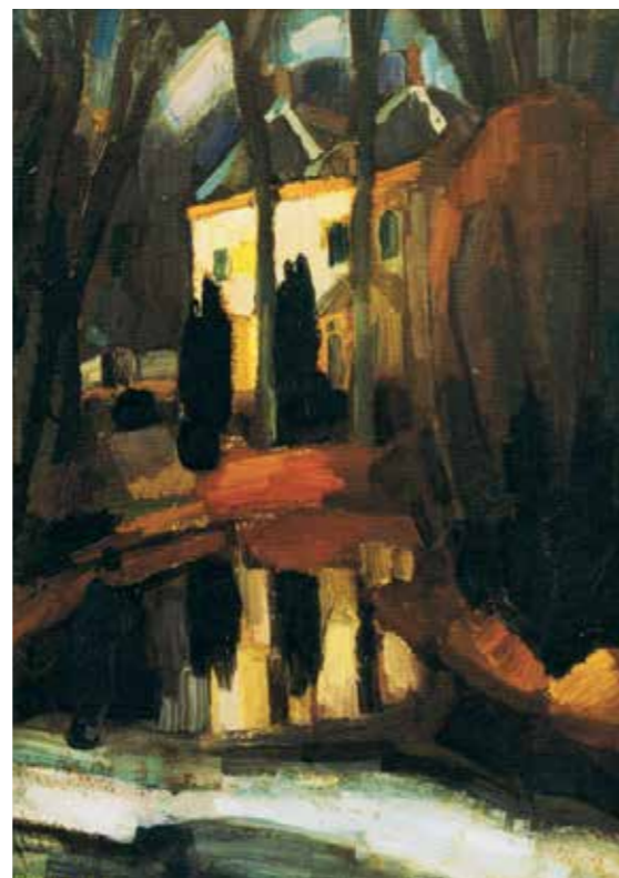
Het Oude Hof