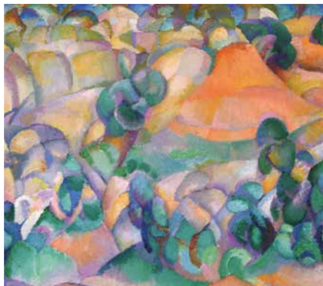
Olijfbomen Mallorca | 1915

Tijdens de eerste wereldoorlog maakte Gestel tekeningen en litho's van vluchtelingen uit België in de buurt van Roozendaal. Hij deed dit deels ook omdat hij na zijn avontuur in Mallorca geldgebrek had. Hij kon deze tekeningen en litho's goed verkopen. Ze kregen een heel goede kritiek, omdat weer zijn grote tekentalent bleek. Deze litho's werd zelfs gebruikt voor de tentoonstelling van zijn werk over de vluchtelingen in Den Haag. De opbrengst was gedeeltelijke voor het comité au secours des victimes belges. Hier zie je zeer verschillende vluchtelingen met op de achtergrond de brandende stad Antwerpen, hetgeen de dramatiek van deze expressionistische litho versterkt.