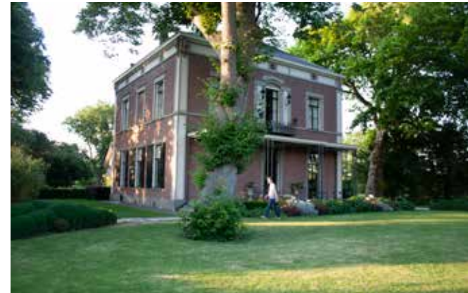
Op bezoek bij Fred van der Worp, pagina 8