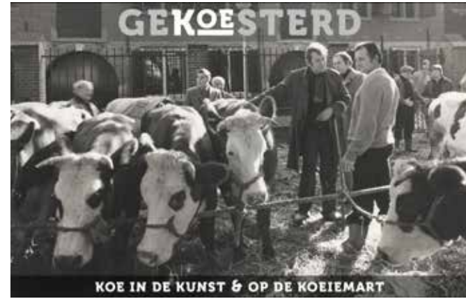
Singelkunst 2022, pagina 5