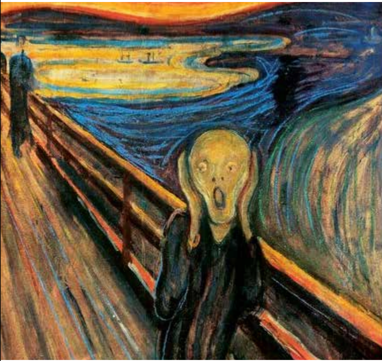
1. Edvard Munch | De Schreeuw | 1893