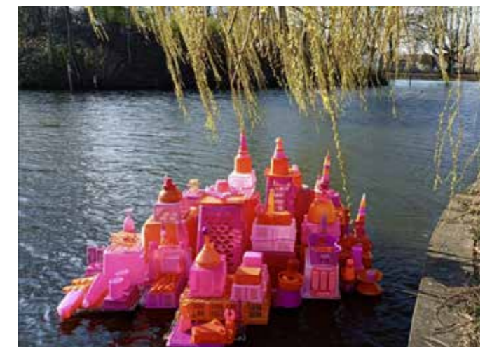
Carolien Adriaansche | opbouw floating cities | Singelkunst Woerden 2022