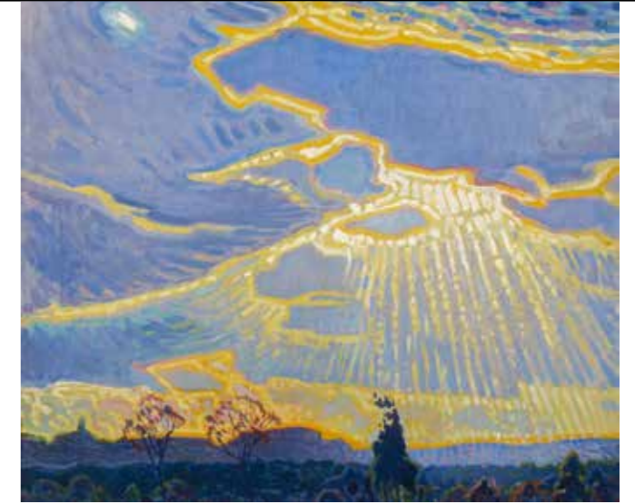
21. Leo Gestel | Herfst | 1919

Leo Gestel had als een van de grote vernieuwers van de Nederlands schilderskunst al een naam opgebouwd. Als hij tot een vorm van expressionisme geraakt, is dat betrekkelijk laat in zijn carrière, na de schitterende luministische en kubistische