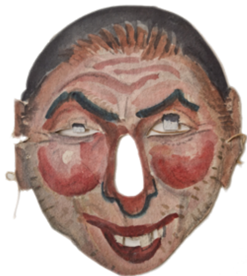
Een van Gestels maskers die het Stadsmuseum graag in de collectie wil hebben.

Defensie-eiland - van werkplaats tot woonwijk sluit mooi aan op het thema 'Erfgoed en architectuur' van de Open Monumentendagen 2025. Op 13 en 14 september is het museum