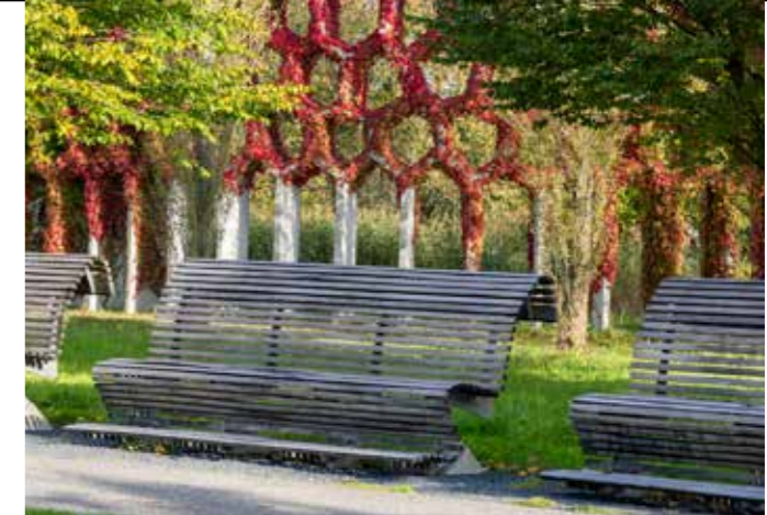
Herfst in het Máximapark.