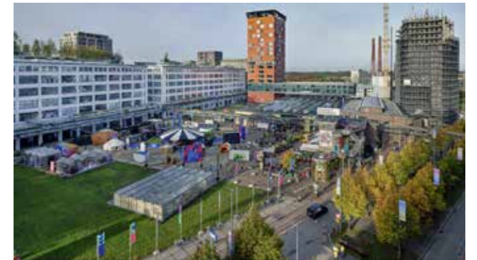
Festival op Strijp-S. Lichtkunst op Strijp-S.