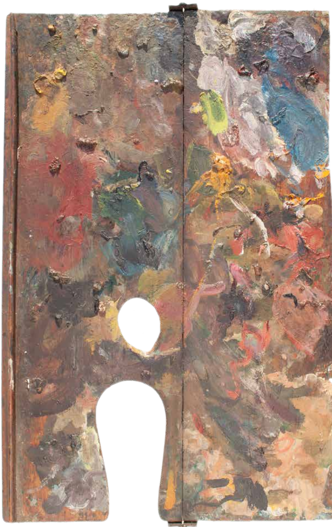
Mooi vooruitzicht: Stadsmuseum Woerden krijgt het palet van Leo Gestel in bezit (pagina 8).