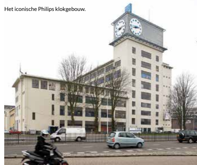
Het iconische Philips klokgebouw.

Een heel verrassend ongewoon verhaal over hoe het enorme industriegebied van Philips transformeert in een levendige wijk, voor mensen van allerlei slag, met winkels, vervoer, cultuur en veel natuur.