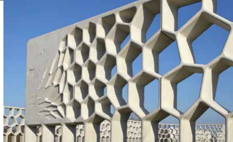
De Parkpergola, een doorzichtige rand van ca 1 km. lang en 6 m. hoog.

Vervolgens De Jeremiebrug met een heel eigen verhaal over hergebruik met verderop een beetje verborgen de verrassende Vlinderhof. Dit is een particulier vrijwilligersinitiatief van een tuin naar ontwerp van de inmiddels wereldberoemde tuinarchitect Piet Oudolf. Deze tuin als een impressionistisch schilderij, was zijn eerste openbare tuin.