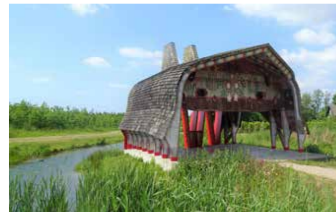
Boven: De Wood Chapel van kunstenaar William Speakman met beschilderingen van Gijs Frieling (onder).