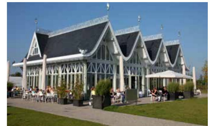
Waterrijk Woerden. Bron foto: West 8

Het Anafora-parkrestaurant. Anafora betekent in het koptisch Dank offer en vrij vertaald Samen iets vieren . Het gebouw uit 2011, heeft een geschulpte dakrand, de daken hebben een zinken ajourachtige versiering en op de hoeken staan zinken uilen. Ontwerp: West 8. Het ontwerp voor een bierhal van architect Pierre Cuypers was daarbij hun inspiratiebron. Bron: Wikipedia.