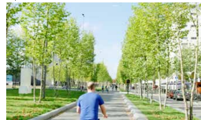
De platanen allée.

Beeldbepalend is ook een levensgrote buste van Gerard Philips, van 8 meter hoog van staal, waar je door zijn stropdas kunt lopen. Een enorme voormalige glasfabriek wordt getransformeerd met ruimte voor allerlei kleinere bedrijven (1500) met een restaurant in het voormalige ketelhuis. De wijk is nog niet afgerond, maar nu al komt heel Europa kijken.