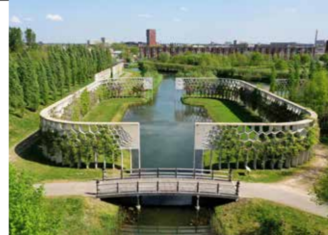
De Parkpergola is opgebouwd uit betonnen honingraatelementen.

Kortom, wij zijn getuigen van een transformatie die zijn weerga niet kent. December 1997 ging de eerste paal van Leidsche Rijn de grond in. Nu, anno 2025 heeft dit stadsdeel van Utrecht, inclusief De Meern, Vleuten en Haarzuilens meer dan 90.000 inwoners.