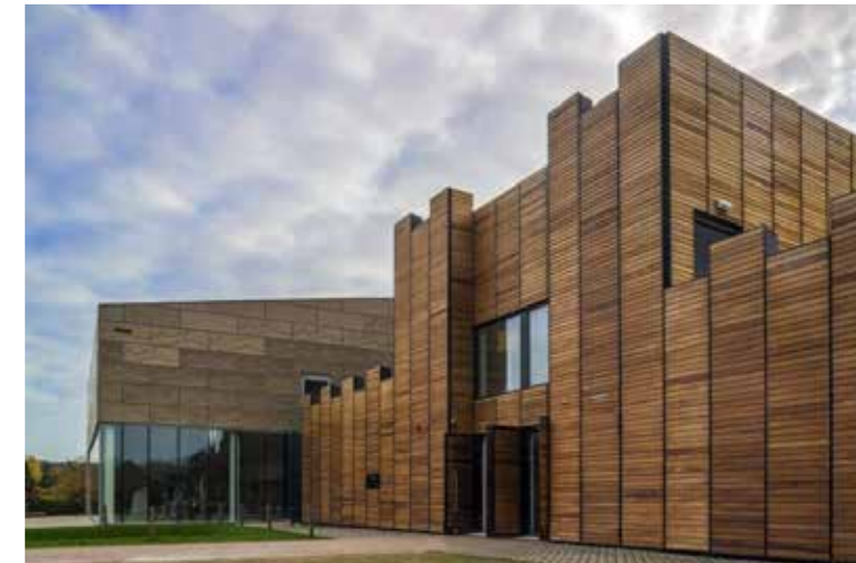
Museum Hoge Woerd. Kroonjuweel van het museum is het schip De Meern 1 de meest complete vondst van een Romeins binnenvaartschip in Noordwest-Europa.

Het Anafora-parkrestaurant. Anafora betekent in het koptisch Dank offer en vrij vertaald Samen iets vieren . Het gebouw uit 2011, heeft een geschulpte dakrand, de daken hebben een zinken ajourachtige versiering en op de hoeken staan zinken uilen. Ontwerp: West 8. Het ontwerp voor een bierhal van architect Pierre Cuypers was daarbij hun inspiratiebron.